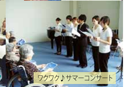
ワクワク♪サマーコンサート