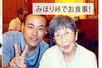
みほり峠でお食事!