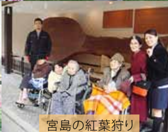
宮島の紅葉狩り 鹿とのふれあい