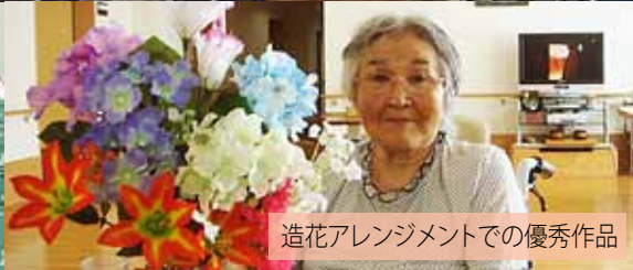
造花アレンジメントでの優秀作品