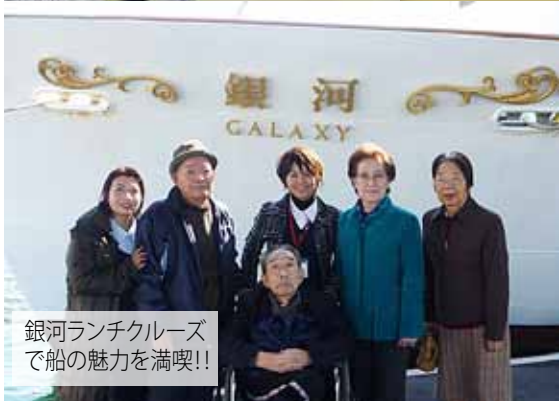
銀河ランチクルーズ で船の魅力を満喫!!