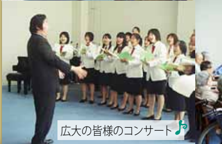
広大の皆様のコンサート🎵