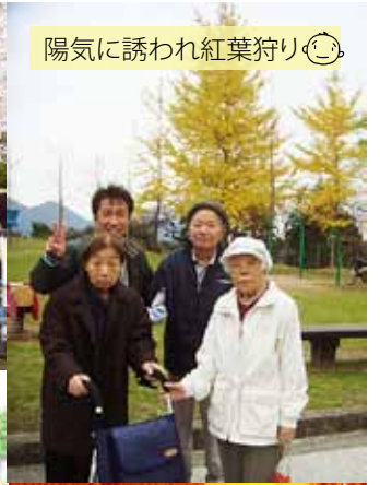
陽気に誘われ紅葉狩り😊