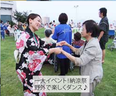
一大イベント!納涼祭 野外で楽しくダンス♪