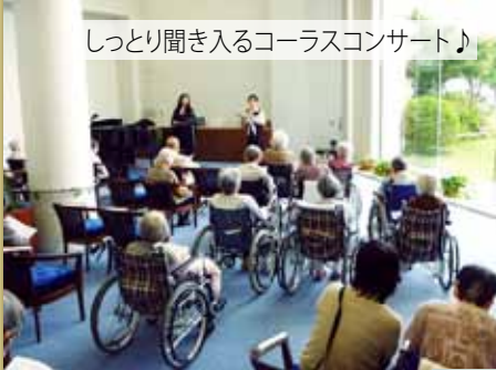
しっとり聞き入るコーラスコンサート♪