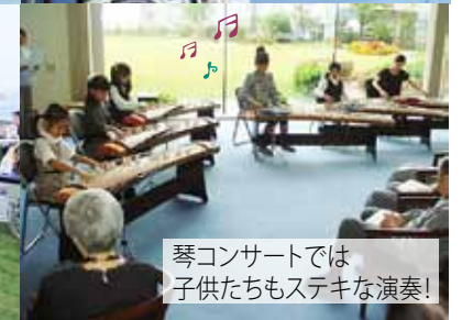
琴コンサートでは 子供たちもステキな演奏!