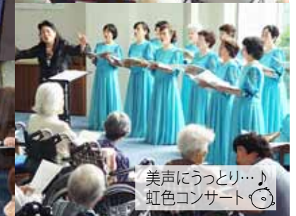
美声にうっとり…♪ 虹色コンサート😊