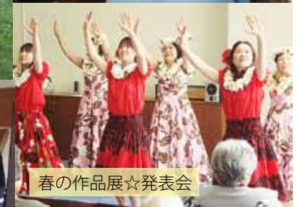
春の作品展☆発表会