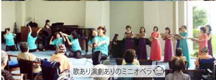
歌あり演劇ありのミニオペラ😊