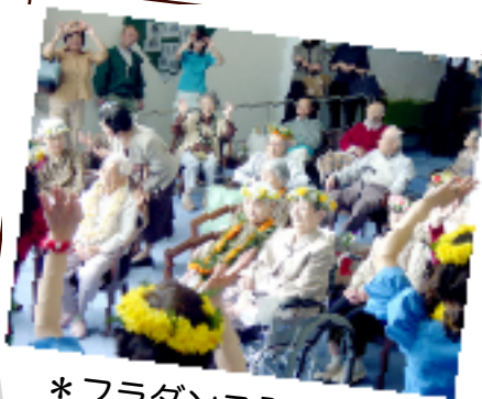
*フラダンス発表会*