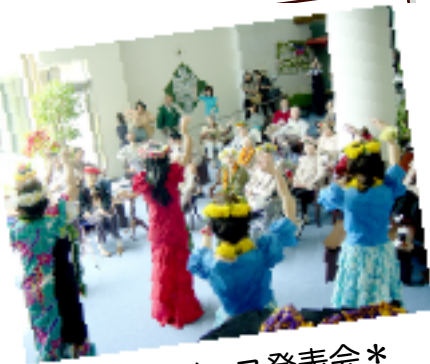
*フラダンス発表会*