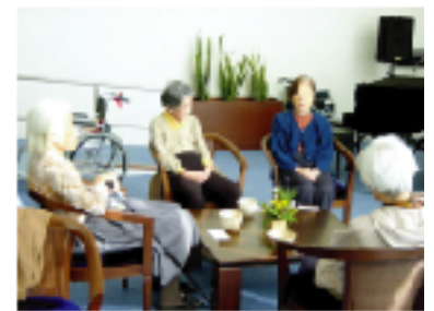
(お菓子) 多津瀬製 「鶏と福寿草」

1月2・3日ラウンジにてお茶と新年のお菓子を楽しんで頂きました。 「昔を思い出すわ」「新年って感じね」「たまにはこういうのもいいわね」と和やかな雰囲気の中で時間が流れました。 慣れない手前を担当したのは事務長で、お運び役は事務局スタッフです。皆緊張しましたが、入居者様一人一人にお茶とお菓子をお渡しする事で気持ちも引き締まりました。いつもラウンジに設置してある立札の短冊は、上田宗箇流家元から頂戴したもので、「喫茶去」ーお茶をのんで行きんさいーという意味が書いてあります。 また企画致しますのでどなた様もお茶を飲みいらして下さいね。