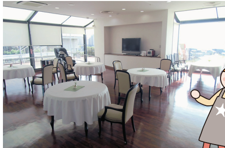
レストランデイルーム