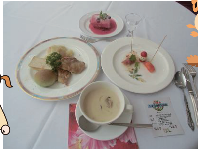
毎月行っているお誕生日会の食事です