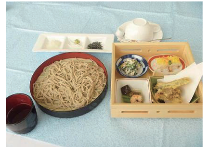
そば打ちを体験した後、昼食で食べました