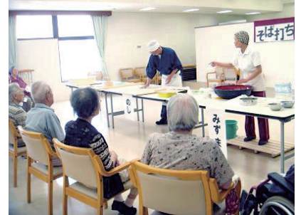
そば打ちの体験模様

より一層明るく、清潔感あふれる憩いの場にリニューアルしました。食事内容についても、皆様の意向に出来るだけ沿えるように、2~3種類の選択制メニューで提供しています。朝食には自家製の焼き立てパンを召し上がって頂いています。