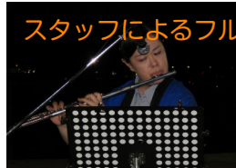
スタッフによるフルート