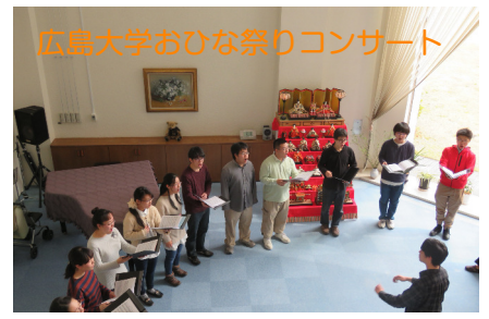
広島大学おひな祭りコンサート