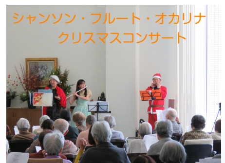
シャンソン・フルート・オカリナ クリスマスコンサート