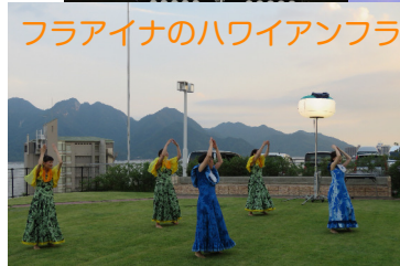
フライナのハワイアンフラ