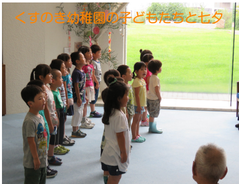
くすのぎ幼稚園の子どもたちと七夕