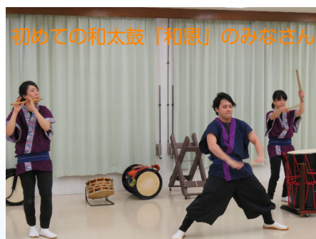
初めての和太鼓「和恩」のみなさん