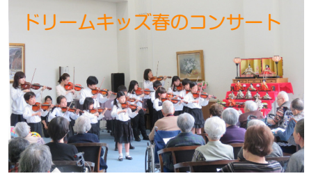
ドリームキッズ春のコンサート